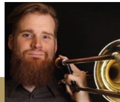
KURSE IN IMPROVISATION UND RHYTHMIK LEVEL 1 – 3